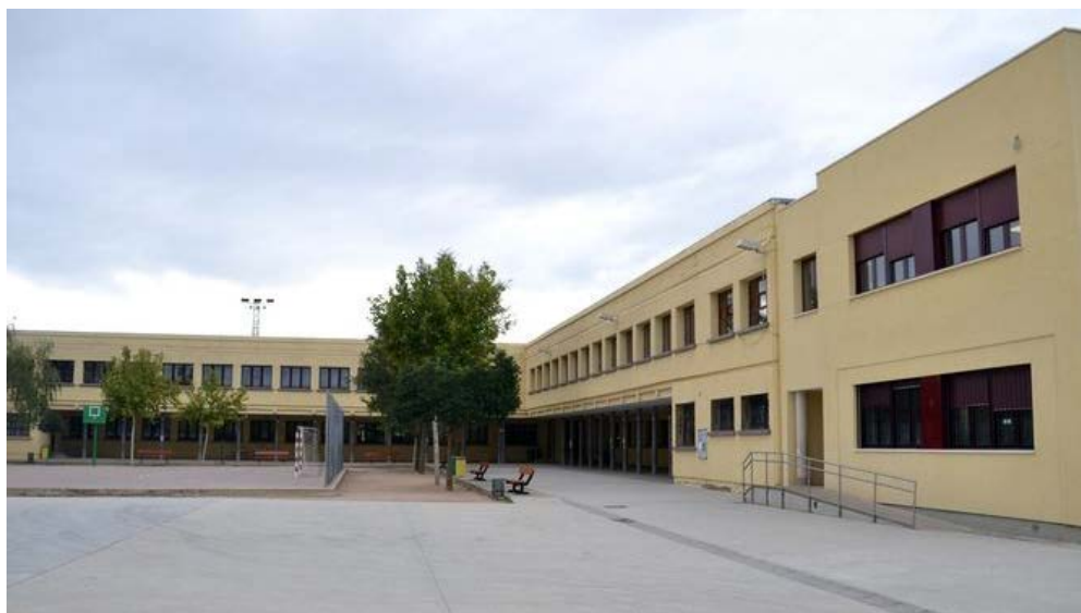
Un total de 10.000 alumnos aragoneses se beneficiarán este curso del programa Conexión Matemática ZARAGOZA | EUROPA PRESS

POR EUROPA PRESS / LAINFORMACION.COM ZARAGOZA | 27/12/2016 - 11:41